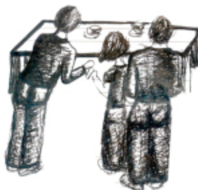
Ilustración 1. Dibujo esbozado en las notas de campo, ilustra el momento en el que los jóvenes hacen fila para sentarse a comer, cada uno toma una tortilla proporcionada por uno de los compañeros para después buscar su lugar en la mesa.

Al instalar la mesa los jóvenes que no participan en ello permanecen sentados en la sala de estar que son dos sillones colocados en el pasillo donde ellos esperan. El estudiante encargado de preparar la mesa va colocando en un lugar la comida y utensilios que cada uno de sus compañeros utilizará. Los ciegos tiene un lugar específico donde sentarse, no es elegido aleatoriamente es designando por la directora.