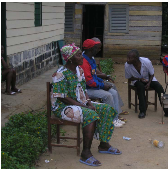
Mujer vistiendo un popó con estampados mostrando la efigie del actual dictador Teodoro Obiang Nguema (Akurenam, Guinea Ecuatorial, 2010).

Estas diferentes características de la visibilidad –reconocimiento, descontextualización y control– se engarzan a la perfección, como resulta evidente, con los parámetros de la lógica social de la identidad, el orden y jerarquía social, y la necesidad del intercambio (Martí, 2010a: 109). Por lo que respecta a este último aspecto, resulta fácil establecer la relación entre el reconocimiento que conlleva la visibilidad y las affordances o prestaciones de las que nos habla el marco teórico de la psicología ecológica de James Gibson 5 . Con la presentación social del cuerpo se visibiliza lo que el individuo predispone a que se haga con él, o lo que pretende o puede hacer a los otros. Así, la mujer musulmana residente en Occidente, mediante el uso del hidjab , bloquea su espacio a la mirada del otro (Marco, 2008: 405) pero al mismo tiempo predispone la interacción con otros musulmanes (Marco, 2008: 407). Cuando las normas de solidaridad están bien marcadas entre miembros de un mismo clan, la señal identitaria de un tatuaje o escarificación faciales es fácilmente traducible en términos de affordances , como cuando dos personas portando las mismas señas se encuentran cara a cara fuera de su lugar de origen, por ejemplo, en una gran ciudad.