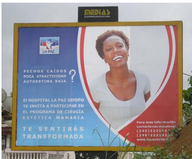
Modernas técnicas de modificación corporal (Malabo, Guinea Ecuatorial, 2012).

a nuevos patrones formales de presentación social del cuerpo vehiculados a través de los medios de comunicación en un contexto de globalización, así como los nuevos productos y tecnologías relacionados con los cuidados corporales que se difunden por redes internacionales inciden de manera poderosa en la presentación corporal al multiplicar las posibilidades de performar el cuerpo moderno . Ya hemos mencionado en líneas anteriores el caso de la introducción de nuevos diseños de tatuajes según estilos completamente internacionalizados. Otro buen ejemplo para ello lo constituyen aquellas modificaciones que han sido calificadas de desnaturalizadas como las en África tan extendidas prácticas de blanqueamiento de piel mediante productos cosméticos distribuidos por el mercado internacional (Blay, 2011: 22-23) o tratamientos capilares para evitar el encrespamiento del cabello.