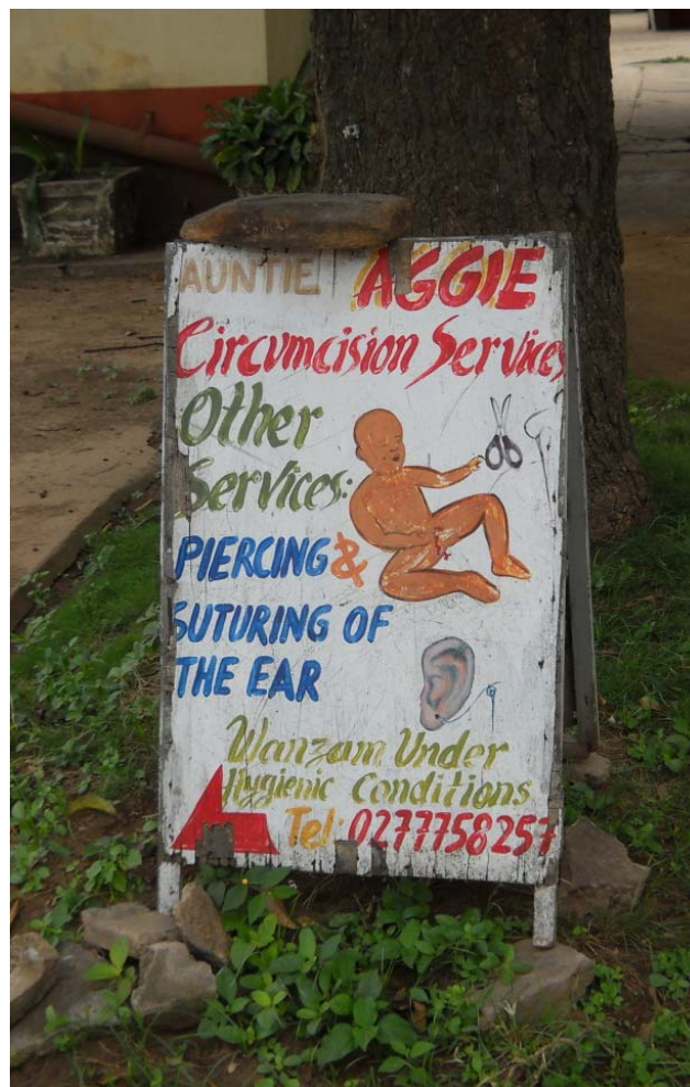
El wanzam o circuncisador se anuncia haciendo mención expresa a las “condiciones higiénicas” (Accra, Ghana, 2011).

para estas prácticas, justificaciones que se van adaptando a los nuevos discursos que acompañan la modernidad. Así por ejemplo, unas de las razones de tipo emic por las que se justifica actualmente la práctica de la circuncisión masculina en Guinea Ecuatorial son las de la higiene, o bien la de tipo pragmático que entiende que la extracción del prepucio facilita la tarea reproductiva del coito (Martí, 2010b: 67). Estas ideas contrastan claramente con aquellas legadas por la tradición que relacionan la circuncisión con la potencia sexual masculina. Por eso hay quien piensa que al ir desapareciendo los elementos rituales en la práctica de la circuncisión, los hombres son sexualmente menos potentes que en el pasado (Martí, 2010b: 72). Al mismo tiempo, mientras que en la memoria todavía se mantiene vivo el recuerdo de que antes se remuneraba al circuncisador mediante especies, actualmente ello se hace con dinero, algo asimismo que se asocia fácilmente con la vida moderna .