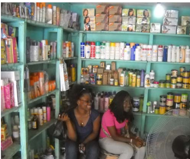
Puesto de venta de productos cosméticos. Los tratamientos para blanquear la piel tienen una fuerte demanda (Bata, Guinea Ecuatorial, 2012).