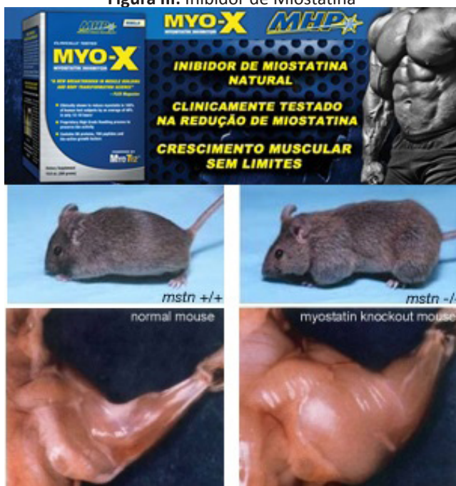
Figura III: Inibidor de Miostatina