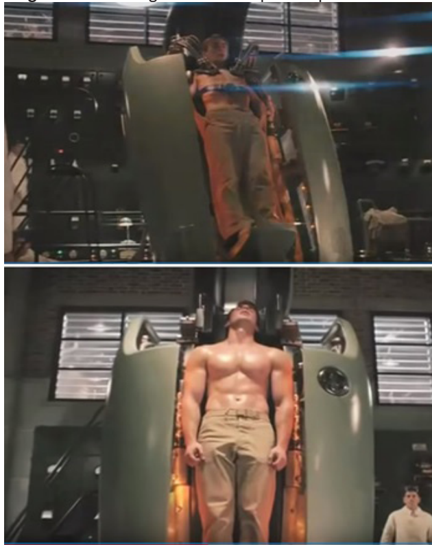
Figura II: Steve Rogers antes e depois do procedimento.